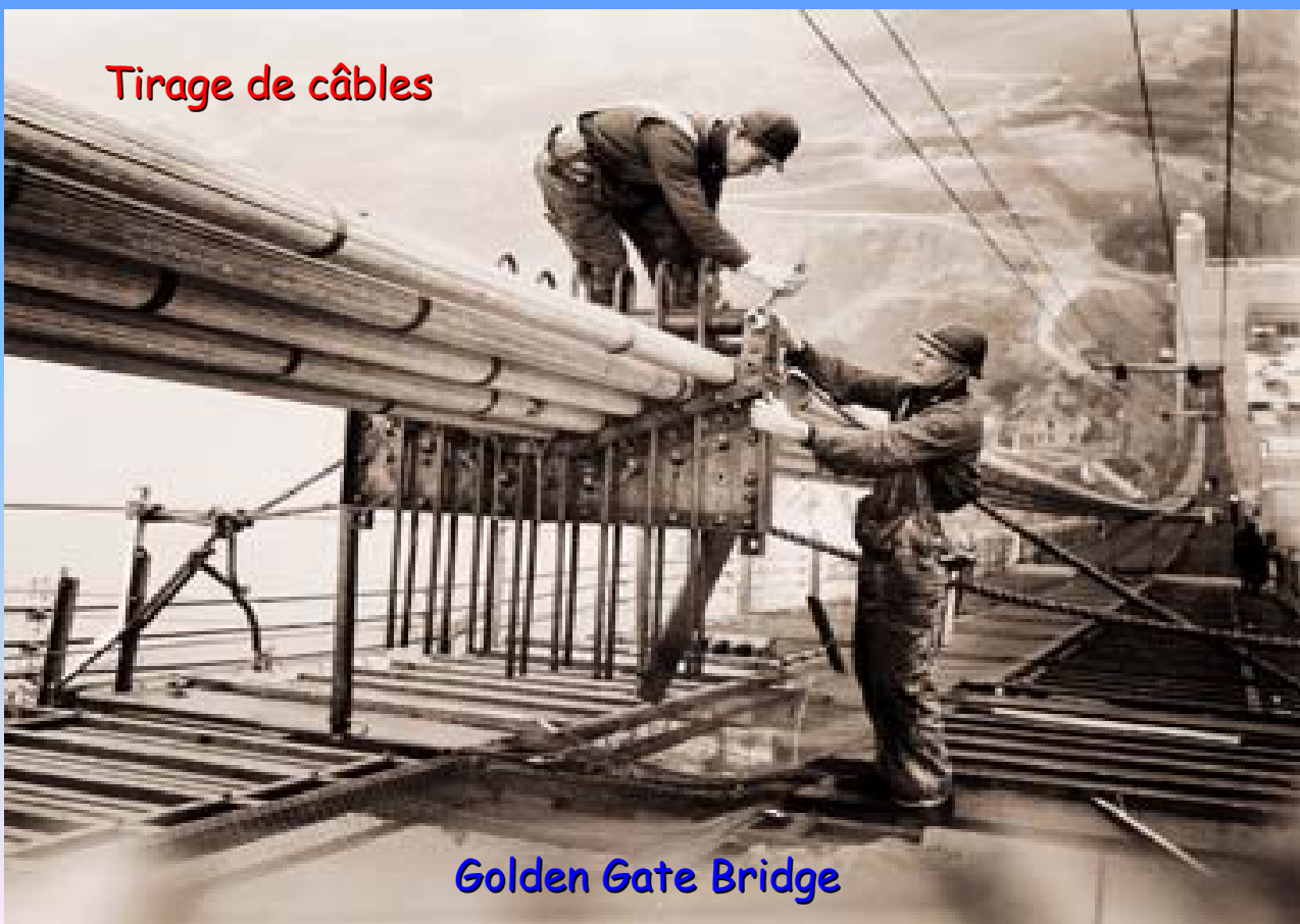
Golden Gate Bridge