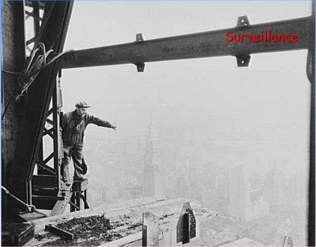
Empire State Building