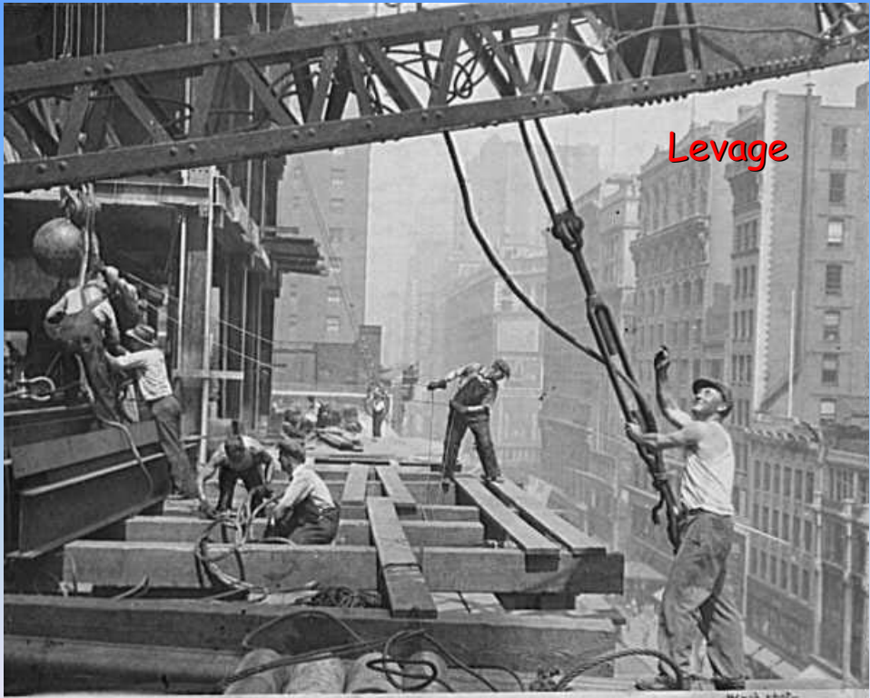
Empire State Building