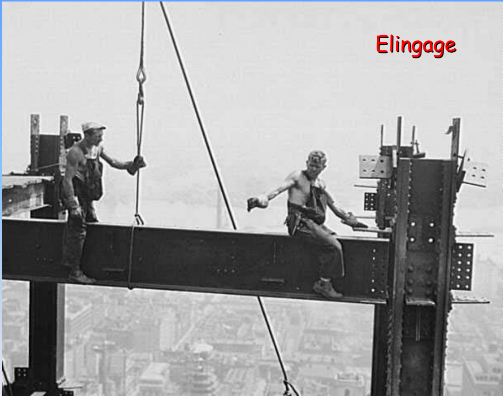
Empire State Building